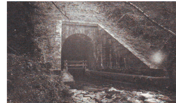
Pont Hir canalise sur 100 mètres la rivière Koad Toulzac'h sous un important remblai.