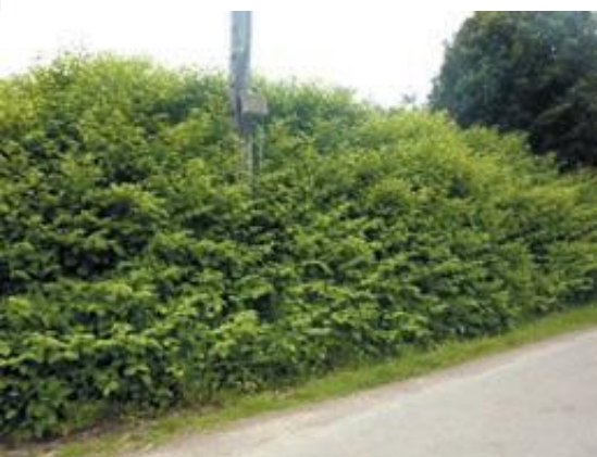
Renouée du Japon