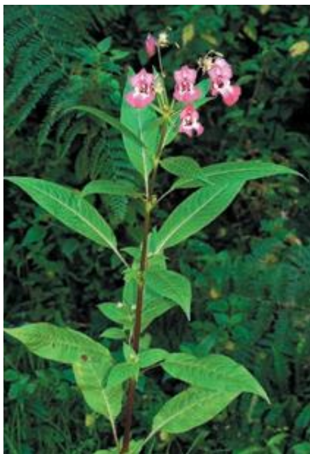
Balsamine de l'Himalaya

Quant aux bambous, lauriers palmes, rhododendrons ou herbes de la Pampa, c'est avant tout aux citoyens de veiller à ce que les plantes de leur jardin ne s'échappent pas.