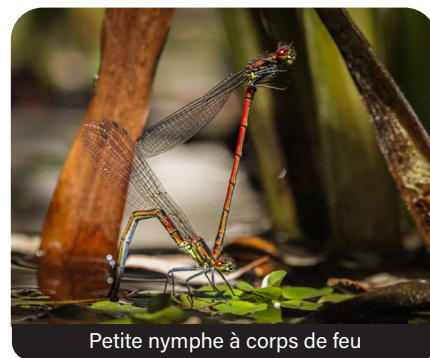
Petite nymphe à corps de feu